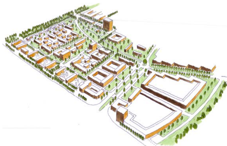
Vertiefungsbereich Rheinstraße Leitbild

Rahmenplanung Quadrant III, Weststadt Darmstadt Projekt