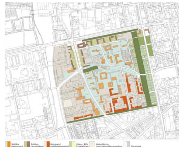
Analysepläne Erschließung und stadträumliches Gefüge