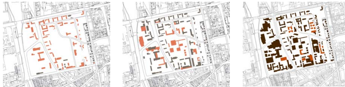
Darstellung der historischen Entwicklung von 1945 bis Heute

Rahmenplanung Quadrant III, Weststadt Darmstadt Projekt