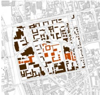
Verteilung der FH Nutzungen